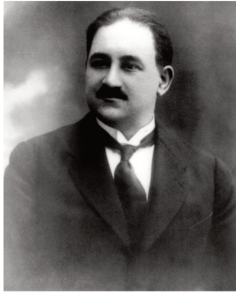
İlk Azərbaycan Şurayı-Millisi rəisi və “Müsavat” firqəsi Mərkəz Komitəsi sədri Rəsulzadə Məhəmməd Əmin

Bu gün istiqlal səneyi-dövriyyəsi olmaq münasibətilə Heyəti-Vükəla rəisi və nazirlər bizzat gündüz saat 1-dən 4-ə qədər qəbuli-təbrikat edəcəkdir.