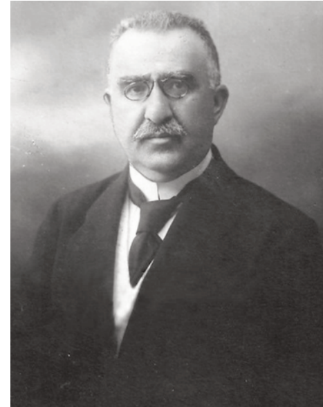
Əlimərdan bəy Topçubaşov Sülh konferansında Azərbaycan Heyəti-Mürəxxəsesi rəisi

Lakin eşq və sevdadan bilavasitə hürriyyət və istiqlala ərişmək mühal və mümtənidir [mümkünsüz və çətindir]. Zira