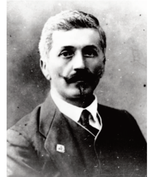
Həsən bəy Ağayev Azərbaycan Məclisi-Məbusan Rəyasəti Baş müavini

eşq ilə hürriyyətin arasında öylə böyük-böyük uçurumlar, mümaniətlər [manea-lər] mövcuddur ki, buralardan millət karvanını təhlükəsiz bir üsulla keçirmək üçün hürriyyətpərvər şüəramızdan böyük zəka və məharətlər tələb olunur. İndi baxalım ki, şüəramız bizi bu uçurumlardan nə kimi vasitələrlə xilas etmişlər.