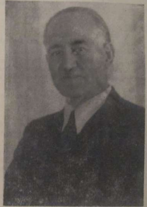
Milli Azərbaycan Şurası Başkanı Mehmet Emin Resulzade (31. Ocak. 1884 — 6. Mart. 1955)

Kahıttın dönecek bir gün yurduna, Ey büyük ülkücü benzersiz önder! Yaparlar adına anıt Bakü'da, Ey vatan uğrunda can veren asker!