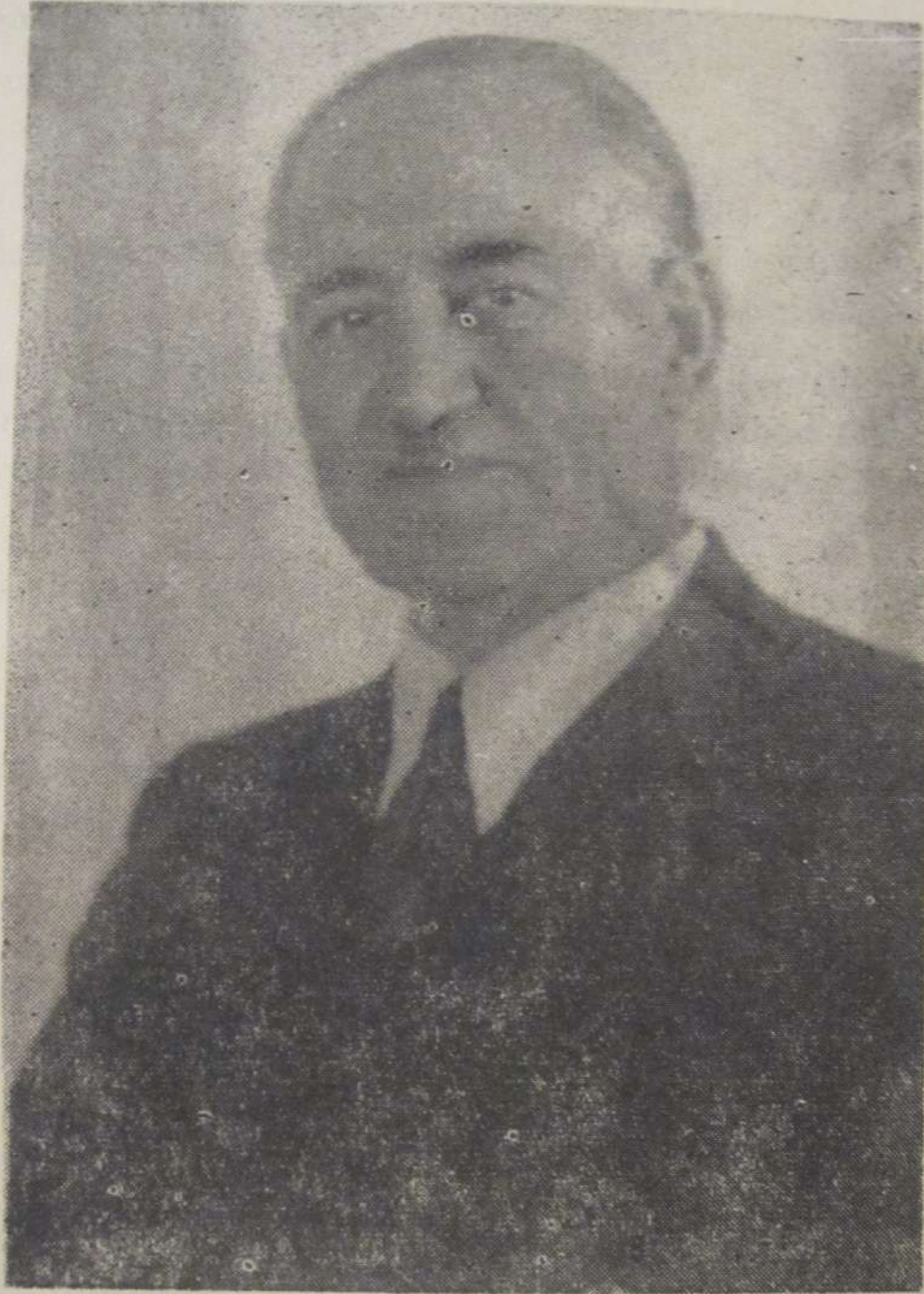
Milli Azərbaycan Şûrası Başkanı Mehmet Emin Resulzade (31. Ocak. 1884 — 6. Mart. 1955)